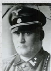
De gevreesde SD'er Viebahn

Het verrichten van research en het zoeken naar personen is een vak dat men alleen in de praktijk kan leren. Je komt vaak voor verrassingen te staan. Zoals bij de oorlogsmisdadiger die zijn levenlang gezweven had over zijn verleden, zelfs tegen zijn vrouw, en die bij de vreemde tegenover zich ineens alles opbiechtte. Of het contact met de hooggeplaatste politicus die een dramatisch verzetsverleden bleek te hebben verzonnen en die in zijn val niet alleen een journalist maar ook een gerenommeerd psychiater meesleepte.