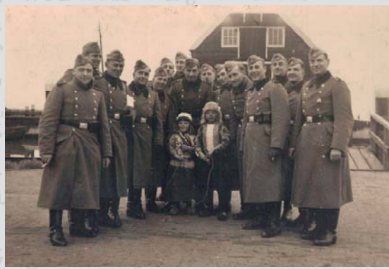
Zomer 1940, Duitse soldaten met 'zuiver-arische' kinderen op Marken