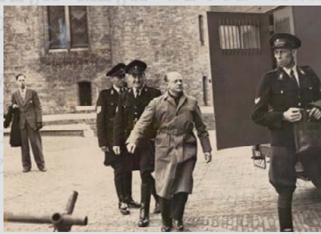
Schreieder, bedenker van het 'Englandspiel' op weg naar zijn berechting

Tijdens de lezing laten zij zien hoe de sprookjeswereld van Hitler en de zijnen veranderde in een catastrofe. Wat betekende het om een vreemde macht door de straten te zien marcheren. Kon men neutraal blijven? Waarom koos iemand er voor in het verzet te gaan en de ander bij de NSB of SS? Wat betekende de oorlog voor het gewone leven? Voor de gewone man en vrouw in de straat?